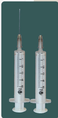
ذوب کننده سوزن سرنگ